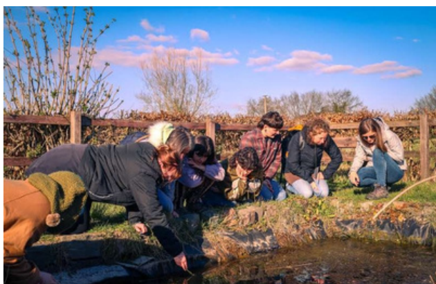
Et dans de nombreuses structures