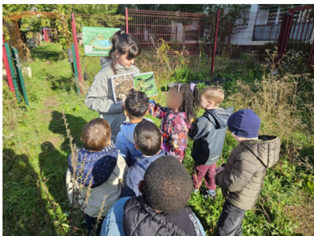
On expérimente en situation réelle d'animation