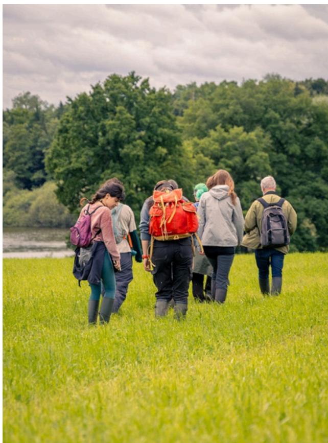
En itinérance c'est parfois à pied...